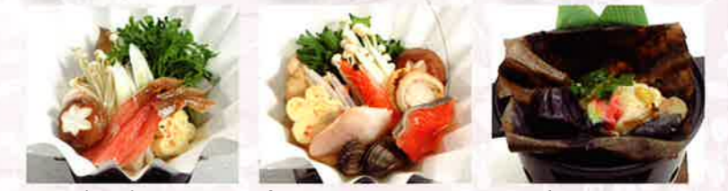
カニすき鍋 寄せ鍋 陶板