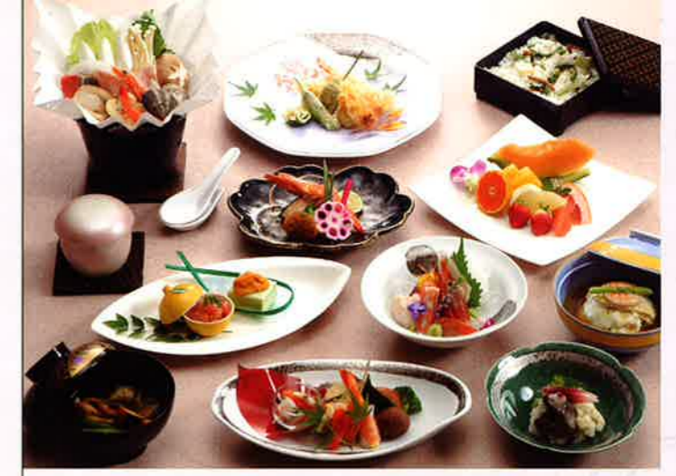
音更シテイホール 和食膳 [全12品] 10,500円 [税込]