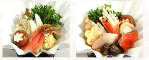
カニすき鍋 寄せ鍋