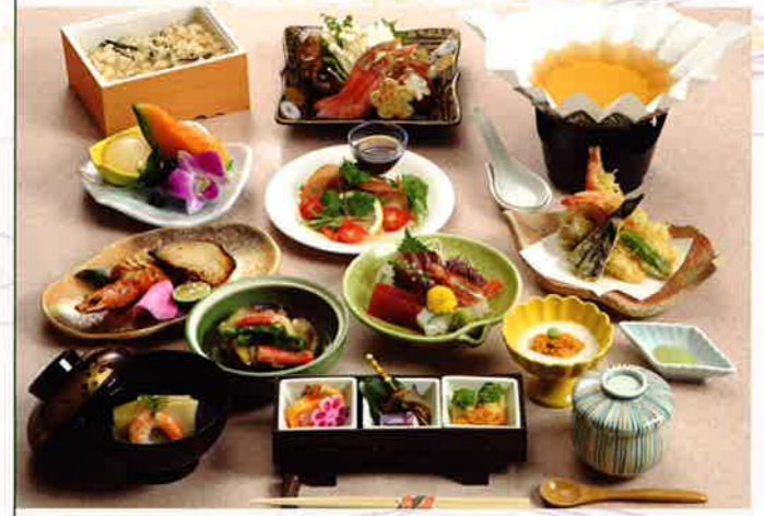
セレモニーホール・西シテイホール 和食膳 [全12品] 10,500円 [税込]