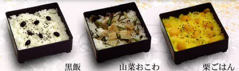
黒飯 山菜おこわ 栗ごはん