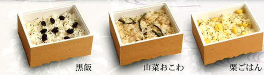
黒飯 山菜おこわ 栗ごはん